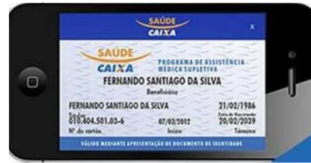
App versão antiga