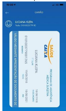
Cartão APP novo